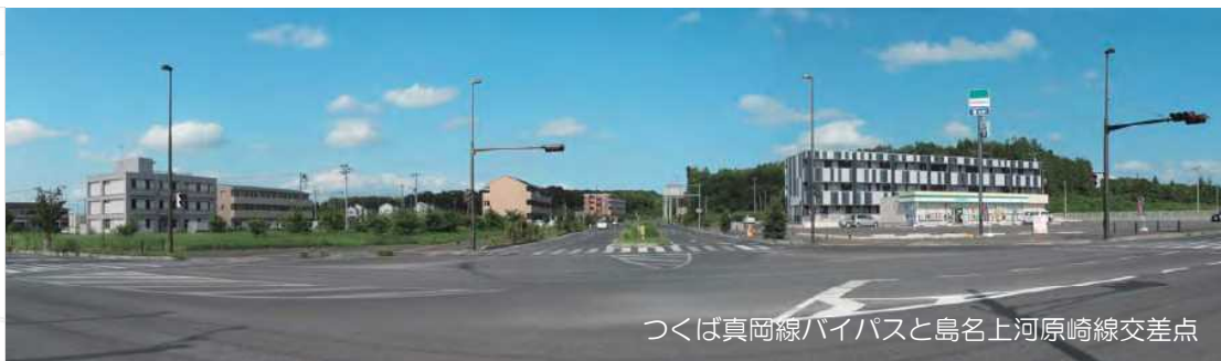
つくば真岡線バイパスと島名上河原崎線交差点