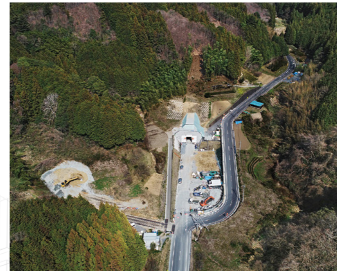
北沢トンネル工事（積算・工事監督補助：常陸太田工事事務所）