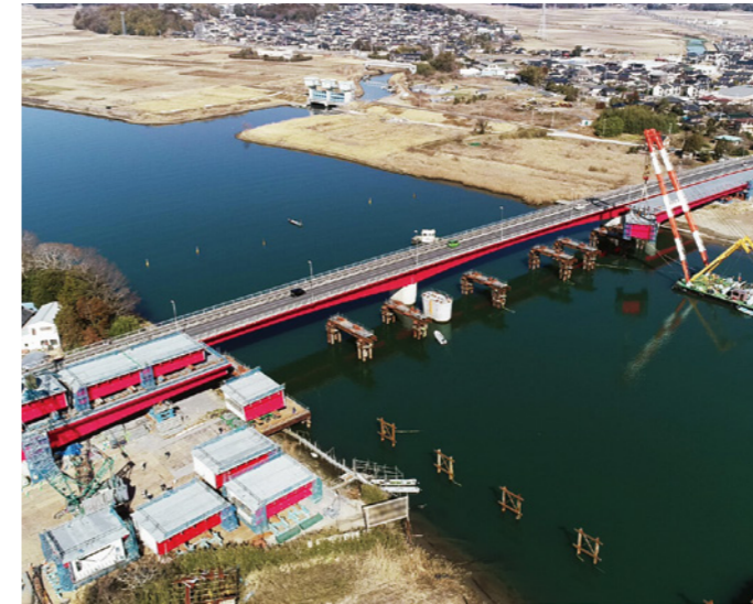
湊大橋上部工架設工事（積算・工事監督補助：水戸土木事務所）