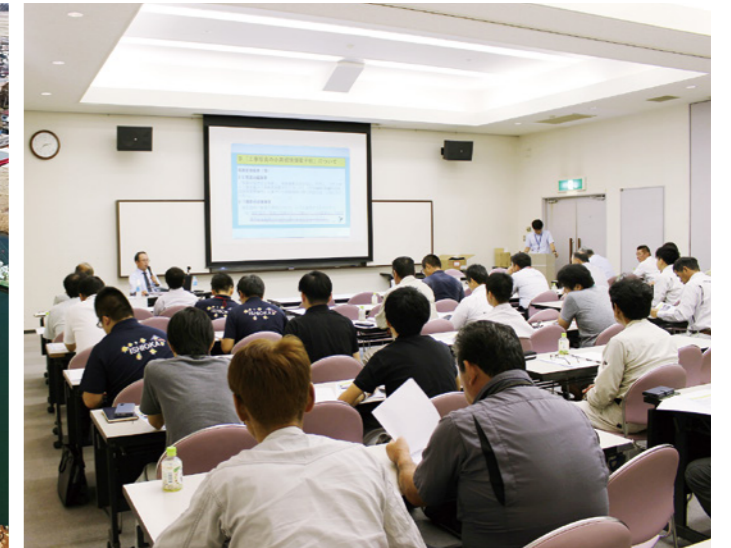
要請による出張研修（石岡市）