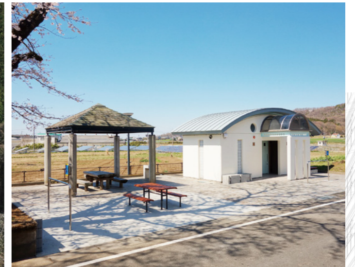
自転車道大和休憩所改修工事 （設計・積算・工事監理：筑西土木事務所）