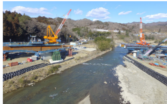
国道118号袋田バイパス (積算業務：常陸大宮土木事務所大子工務所)