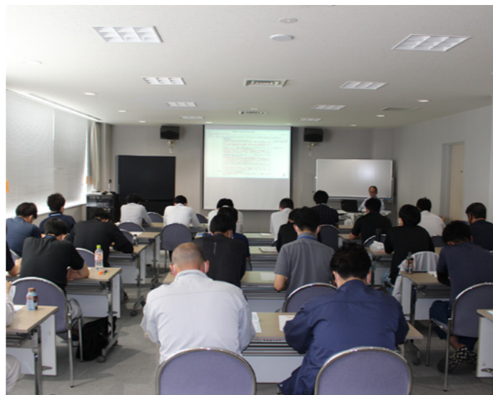
要請による出張研修(常陸大宮市)