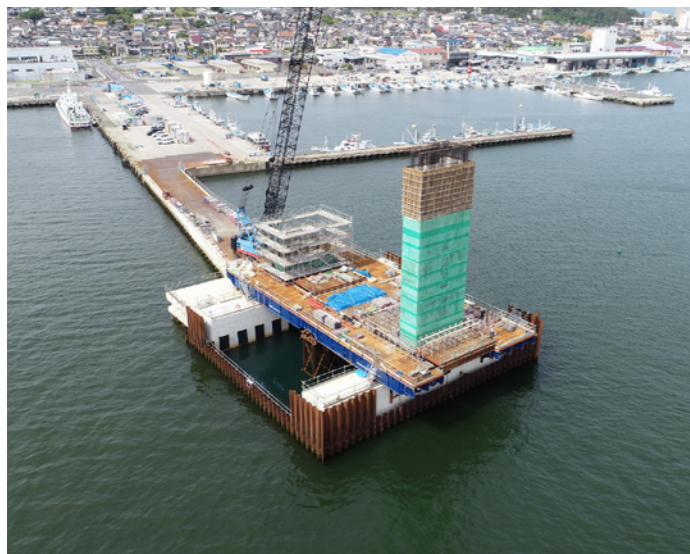
水門上部工事 (積算・工事監督補助業務：茨城港湾事務所大洗港区事業所)