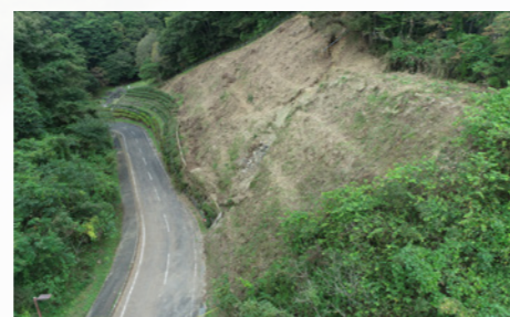
災害復旧工事 (査定設計書作成業務：常陸大宮土木事務所大子工務所)