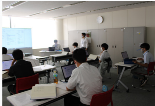
市町村職員建設IT研修（積算システム）