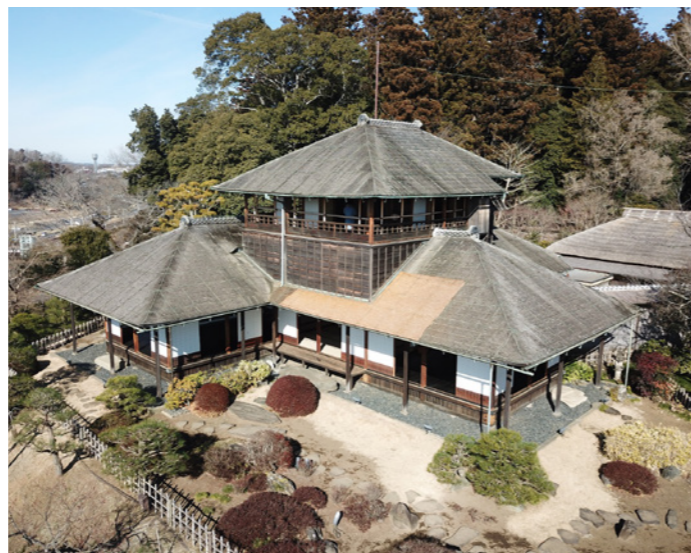
偕楽園公園好文亭(楽寿楼)耐震補強工事 (工事監督補助業務：水戸土木事務所)