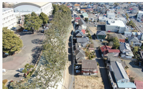
竜ヶ崎第二高等学校 南側法面改修工事 (設計・積算・工事監督補助業務：竜ヶ崎第二高等学校)