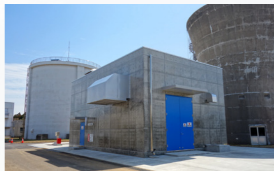
非常用発電機棟建築工事 (積算・工事監理業務：鹿行水道事務所)