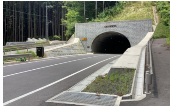
北沢トンネル (積算・工事監督補助業務：常陸太田工務事務所)