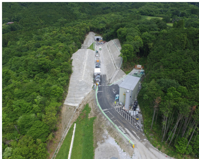
トンネル工事(上曾トンネル) (積算・工事監督補助業務：筑西土木事務所、土浦土木事務所)