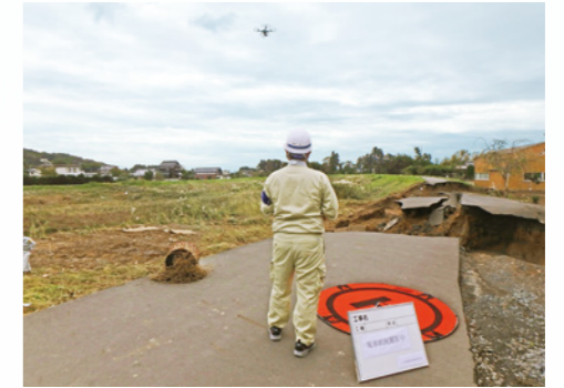
ドローンによる台風19号被災状況調査 （浅川：検査指導課）

河川・道路災害復旧実務要領や直近の事例をもとに、災害復旧事務にかかる研修会を実施します。 大規模災害又は危険箇所については、ドローンによる映像提供を行います。