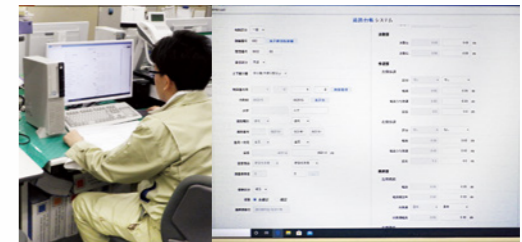
道路台帳更新データ入力状況