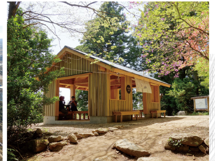
筑波山中四阿（弁慶茶屋跡）建築工事 （設計・積算・工事監理業務：茨城県生活環境部）