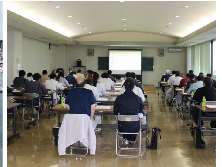
要請による出張研修（石岡市）