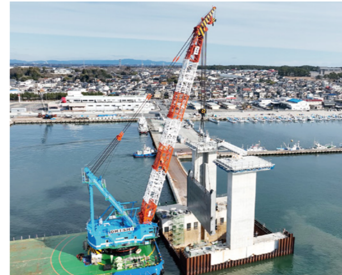
水門ゲート据付工事 （積算・工事監督補助業務：茨城港湾事務所大洗港区事業所）