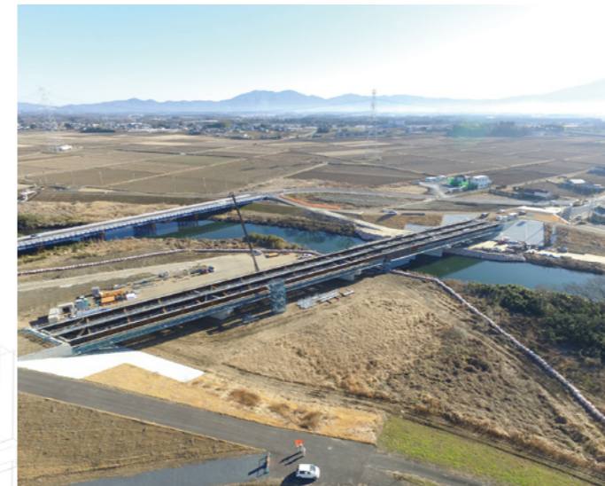
橋梁上部工工事（養蚕橋） （積算・工事監督補助業務：茨城県筑西土木事務所）