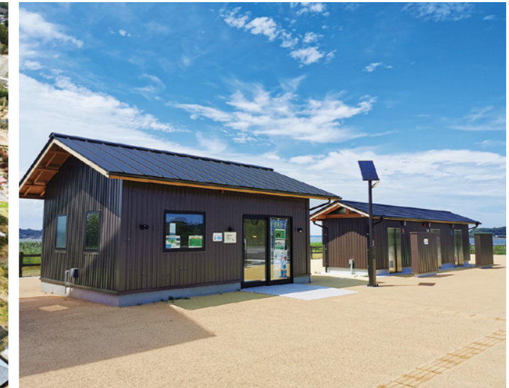
涸沼野鳥公園管理棟・トイレ棟建築工事 (積算・工事監理業務：鉾田市生活環境課)