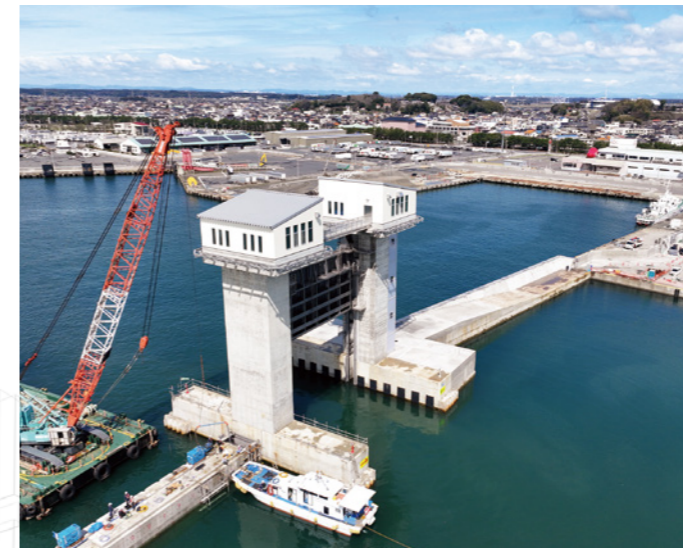
茨城港大洗工区海岸 水門ゲート据付工事 (積算・工事監督補助業務：茨城港湾事務所大洗工区事業所)