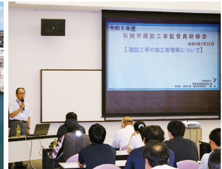
要請による出張研修（石岡市）