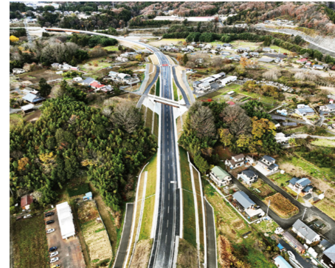
一般国道118号 袋田バイパス 道路改良舗装工事 (積算・工事監督補助業務：茨城県常陸大宮土木事務所大子工務所)